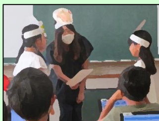
【ロールプレイングの様子】

違いがあっても仲良くすることの大切さについて学びました。お互いの考えをタブレットで共有して話し合い、自分の考えを伝えたり、人の考え聞いたりするなど、様々な人の考えに触れることができました。