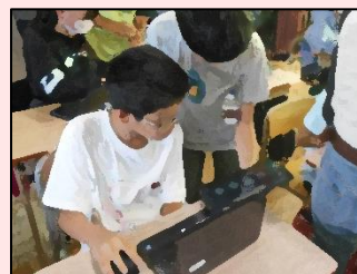
【出題者に答えを聞く様子】

先生が出す問題を解くのではなく、子どもたちがお互いに問題を作り、解き合いました。また、解き方が複数ある問題が出題された際には、自分にふさわしい解き方を選び、考えを共有することができました。