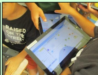
【考えの変化を知る】