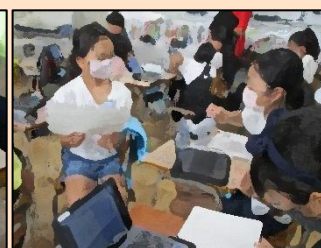
【気付いたことを伝え合う】