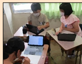
【タブレットで役割分担】

五角形から七角形の内角の和を求めるために、役割分担をして協働的に学ぶことができました。分かったことを表にまとめて共有することで、子どもたち自身が多角形の内角の和の決まりに気付くことができました。