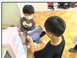
【協力して見付け出す様子】

見付けた直角はタブレットを使って共有し、友達と協力することで予想よりたくさんの直角があることに驚いていました。